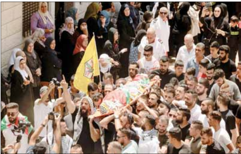
جنازة حاشدة للطفل الشهيد في الضفة الغربية

■ القدس المحتلة - واشنطن - وكالات أنباء: شد وزير الخارجية الأمريكي الإسرائيلي يانير لايد - على أهمية سرعة الانتهاء من التحقيقات في قضية اغتيال الصحفية الفلسطينية شيرين أبو عاقلة وكان النائب العام الفلسطيني المستشار أكرم الخليلي قد أكد في تقرير رسمي، أن جنديا من جيش الاحتلال الإسرائيلي أطلق الرصاص بشكل مباشر على «أبو عاقلة». جاء هذا في الوقت الذي طالب فيه ٨١ عضوا بالكونجرس الأمريكي بليكن بالضبط على حكومة الاحتلال الإسرائيلي، لمنع تهجير ألف فلسطيني من منازلهم في منطقة مسافر يطا بالخليل.