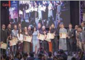
الفائزون بجوائز «الكاثوليكي»