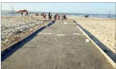
■ مشايات خرسانية لذوى الاحتياجات الخاصة

ومن جانبه كلف الدكتور أيمن مختار محافظ الدقهلية، رئيس مدينة جمصة بالإستمرار في أعمال رفع كفاءة المشايات، والشوارع والميادين بنطاق المدينة، لاستقبال المصطافين خلال فصل الصيف والعمل على راحتهم.