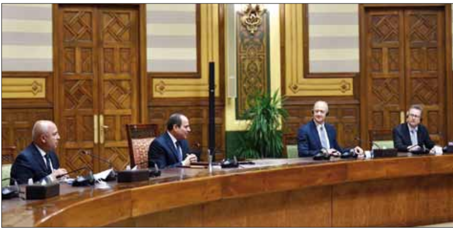
■ الرئيس السيسي خلال لقائه وفد شركة «سيمنز» بحضور وزير النقل

ومعد مؤتمر تغير المناخ في دورته رقم ٢٧ القادمة في شرم الشيخ. واختتم شولتز معلقا على مراسم التوقيع مع شركة سيمنز، بقوله إن توقيع هذه العقود سيشهد إحلال القطارات محل الملايين من الرحلات بالسيارات والناقلات والحافلات وهو ما يعني تقليل انبعاثات الدخان والكربون وتحسين جودة الهواء، مؤكدا أنه يوم جيد للعلاقات الاقتصادية بين مصر وألمانيا ويوم جيد للتقليل من آثار تغير المناخ. وأكد «شولتز» أن مصر الآن قيد التحول لرائدة في تكنولوجيا السكك الحديدية في القارة الأفريقية، معربا عن أمه في أن تحذو دول أخرى حذوها في ذلك، موجها الشكر لمصر على ثققتها في ألمانيا ومهندسيها، وراجيا لجميع المخترطين في هذا المشروع الضخم كل النجاح . قائلا: «لعلنا نقرا بعد بضعة أعوام رواية لكاتب مصري يقص فيها عن مروره بالمنظر الطبيعية بانسيابية بينما يجلس في القطار المتوج من القاهرة لأسوان».