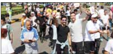
المشاركون في الرالي

بمشاركة ٨٠٠ متسابق من مختلف الأعمار، شهدت بورسعيد فعاليات «رالي» الأول للترجل بالعجلات، الذي أقيم على كورنيش المحافظة (محور عاطف السادات)، وبمسافة ٤ كيلو مترات. أقيم السباق تحت رعاية اللواء عادل الغضبان، محافظ بورسعيد، وجاء في إطار جهود وزارة السياحة، لإضفاء أنماط سياحية جديدة، ومن بينها السياحة الرياضية والشبابية، لترويج للمقاصد السياحية الرئيسية. وقد أعرب المتسابقون عن سعادتهم بالمشاركة في أول ماراثون من نوعه على مستوى الجمهورية، والذي تنوعت أنشطته، لتشمل عروضاً للفلكلور بورسعيد وأغانى السمسسية والرقصات الشعبية، التي أقيمت في أجواء رائعة بحديقة السلام المطورة.