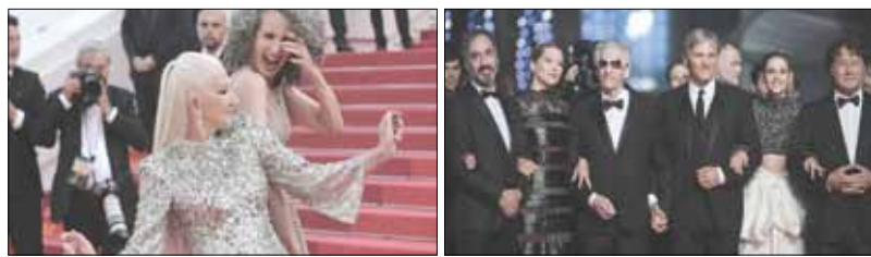
كبار المخرجين والنجوم في كان