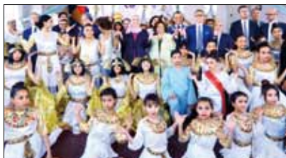
■ نيفين القباج خلال زيارتها مدرسة تواصل

تفقدت نيفين القباج وزيرة التضامن الاجتماعى أمس مدرسة تواصل المجتمعية التى تقع فى منطقة اسطبل عنتري، حيث يأتى ذلك فى إطار الشراكة الاستراتيجية بين كل من وزارة التضامن الاجتماعى وأحد البنوك فى مجالات الحماية الاجتماعية ودعم الأسر المنتجة إلى جانب دعم المشروعات والمبادرات التنموية التى تهدف إلى تحقيق التنمية المستدامة والحفاظ على التراث الثقافي وفقا للأهداف العالمية للتنمية المستدامة ورؤية مصر ٢٠٣٠.