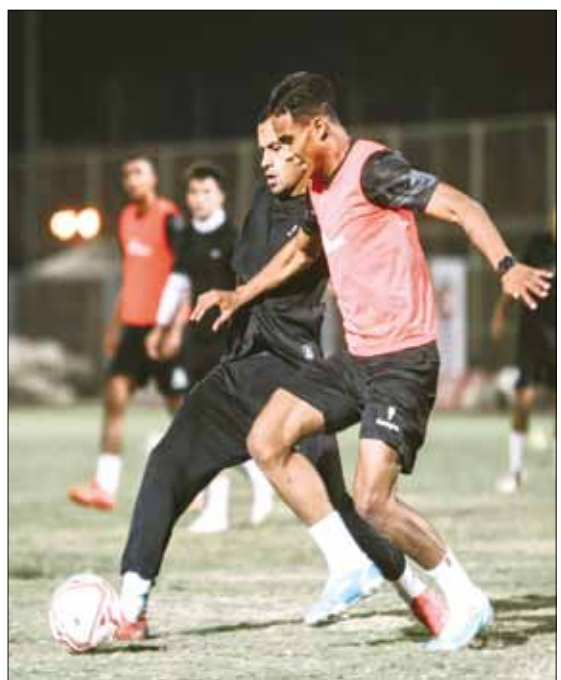
■ الجزيري يواصل الغياب عن مباريات الزمالك

وسبق أن أعلن رئيس الزمالك عدم رغبة النادي في تجديد عقاقده المحترف المغربي، بسبب تراجع مستواه وغياب الحساس عنه بعد أن كان أحد نجوم الفريق منذ انضمامه للقلعة البيضاء.