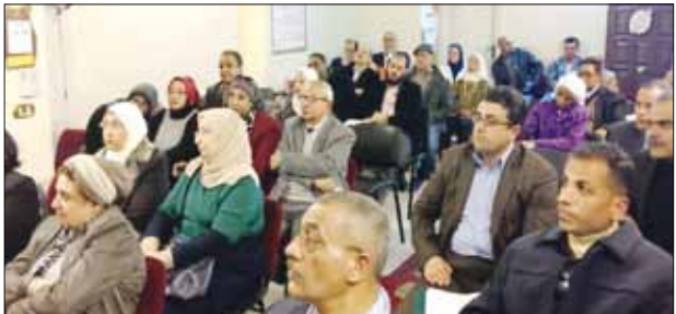
الصالونات الأدبية.. فوائد تاريخية لا يمكن تجاهلها

أنها يمكن أن تحقق أهدافا سامية لا تتحقق بدونها، ومعارض يرى أنها نوع من «الشللية» التي لا تخدم إلا أغراض صاحب الصالون إما بتحقيق مكاسب مادية أو بفرض اسمه على الساحة للتسلق نحو مناصب معينة أو لضمان الوجود الدائم في دائرة الضوء، وفي كل الأحوال يظل السؤال: هل هي من باب «الوجاهة» وتحقيق مصالح ضيقة أم أندية إبداع حقيقي؟