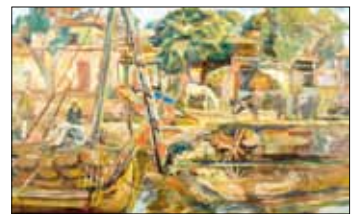
إحدى لوحات المعرض

عشرينيات القرن الماضي، في عصر يشهده مجمع الفنون (قصر عائشة فهمي) في عشرينيات القرن الماضي في مرحلة التكوين الفعلي في بناء قوام الفن المصري الحديث، والقاعدة التي ارتكزت عليها الأجيال المتعاقبة، وتحمل في ذاكرتها رموز تلك الفترة التأسيسية. وأضاف: يتضمن المعرض قرابة الـ ٩٠ عملاً فنياً لـ ٢٠ فناناً ممن شكلت أعمالهم ملامح تلك الفترة الهامة من مسيرة الفن المصري، منهم محمود مختار، ومحمود سعيد، وراغب عياد، ويوسف كامل، وجورج صباغ، ومحمد حسن، وإيمى فر، وسوزان عدلى، وشعبان زكي. يأتي المعرض ضمن احتفاء وزارة الثقافة بحقيقة عشرينيات القرن الماضي عبر تنظيم مجموعة من الفاعليات المتنوعة، والتي تضم نماذج من مختلف الوران الإبداع التي تم إنتاجها خلال تلك الفترة.