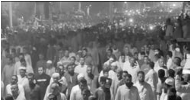
الإهالي في أثناء تشييع جثامين الضحايا

بعد أقل من ٢٤ ساعة نجح رجال الأمن، في كشف غموض المذبحه البشعة التي راح ضحيتها أب وابنتاه وحفيدها بأحدى المزارع في منطقة الريف الأوروبي بالشيخ زايد، حيث تبين أن وراء الجريمة شريك الألب بالمرزعة المستاجرة بسبب علاقة عاطفية مع ابنة الضحية الكبرى، وتم القبض على المتهم بعد هروبه إلى بلدته بسوهاج. وكانت غرفة عمليات الجيزة، قد تلقت بلاغا بالعثور على خمسة أشخاص مذبحون داخل مزرعة بالشيخ زايد، وعلى الفور أمر اللواء علاء، سليم مساعد وزير الداخلية لقطاع الأمن العام، بتشكيل فريق بحث لكشف ملابس الحوادث المذبحه، انتقل رجال الأمن بإشراف اللواء محمد فارس مدير الإدارة العامة لمباحث الجيزة إلى مكان الواقعة، وعثر على جثث الضحايا وهم خنجر ونجلته إحداهما في القعد الثالث من العمر، والأخرى في عقدها الثاني، بالإضافة إلى جثث طفلين حفيدي الخنجر تتراوح أعمارهما