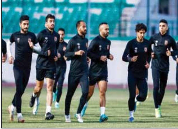
■ تركيز وجدية في تدريبات الأهلي قبل لقاء غد

استقر يتيسر موسيماني المدير الفني للفريق الأول لكرة القدم على التشكيل الذي سيخوض به مواجهة الوداد المقرر لها التاسعة من مساء غد في نهائي دوري أبطال إفريقيا على مركب محمد الخامس.