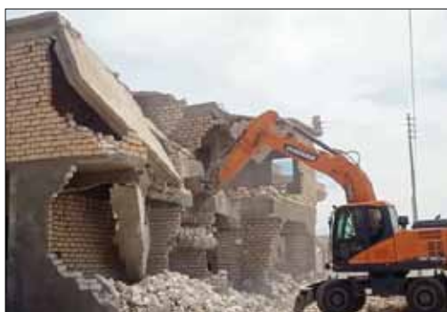
■ جانب من عمليات إزالة المخالفات

بالمنطقة، وناشدت جميع المواطنين الذين تم البيع لهم باى اراض فضاء بمطروح أو من يرغب في شراء أى اراضى بمراجعة ملكية تلك الأراضى بإدارة أملاك المحافظة أو بمقر هيئة المجتمعات العمرانية للتأكد من قانونية تلك الأراضى، لانتة إلى انه سيتم اتخاذ