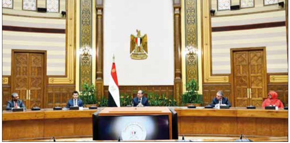
■ الرئيس خلال استقباله وزراء الشباب والرياضة العرب

الفعاليات والمؤتمرات الوطنية والإقليمية والعالمية في هذا الصدد، التي تعكس الدور المحوري للشباب في استراتيجية التنمية الوطنية في مصر. وأضاف المتحدث الرسمي أن الرئيس اقترح، في ختام اللقاء، إطلاق ٢٠٢٣ عاما للشباب العربي، بحيث يتم تنظيم مجموعة من الأنشطة بالتعاون بين العواصم العربية المختلفة على مدى العام، وكذلك دراسة إنشاء اتحاد للشباب العربي، وذلك كآلية متطورة تعمل كجسر ومنصة تسهم في تعظيم التفاعل بين الشباب العربي بشكل منتظم ومنهجي، للتعرف عن قرب على القواسم المشتركة والخصوصيات الثقافية لكل دولة، بالإضافة إلى توحيد الشباب العربي نحو إدراك قضاياهم واهتماماتهم، وذلك لتحقيق أواصر العلاقات على المستوى الشعبي بين الشباب، ومساعدتهم على التصدي للشائعات، وتصويب الانحرافات الفكرية، ومواجهة الأفكار المغلوطة والهدامة والمتطرفة والظواهر السلبية التي تلقى بظلالها على الوعي المجتمعي.