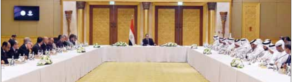
■ رئيس مجلس الوزراء خلال اجتماعه مع المستثمرين الإماراتيين

كشفت الدكتور مصطفى مدبولي رئيس مجلس الوزراء، عن أنه سيتم، خلال الأيام القليلة المقبلة، إعلان قيمة جميع أراضي الصناعة في مصر، بجميع المناطق الجغرافية، بشكل محدد، بأن يتم تخصيصها للمستثمرين، إما عن طريق حق الانتفاع، أو تملكها، مؤكدا أن الحكومة ستقدم تسهيلات في السداد. وكرر رئيس الوزراء تشديده، من جديد، على أن الهدف ليس بيع الأرض، بل سرعة إقامة، وتشغيل مختلف الصناعات، كاشفا عن أن هذه المشروعات ستحصل على «الرخصة الذهبية»، أو «الرخصة الواحدة»، من مجلس الوزراء، وهيئة التنمية الصناعية، على أن تقوم الدولة باستكمال الإجراءات، مع باقي الجهات المعنية بالدولة، خلال ٢٠ يوم عمل، مشيرًا إلى إنشاء وحدة، بالمجلس، لحل مشكلات المستثمرين. جاء ذلك، خلال الزيارة التي قام بها رئيس مجلس الوزراء إلى الإمارات، على رأس وفد رفيع المستوى، حيث التقى عددا من كبار المستثمرين الإماراتيين، بمقر إقامة بابوظبي، بهدف التعريف بالفرض الاستثمارية