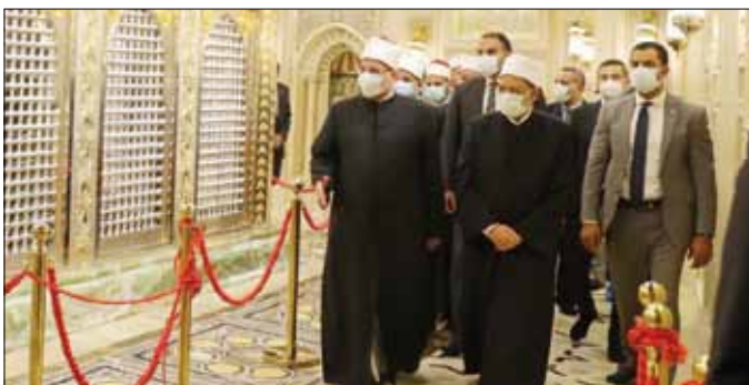
■ فضيلة الدكتور أحمد الطيب خلال زيارته مسجد الإمام الحسين

زار فضيلة الإمام الأكبر الدكتور أحمد الطيب، شيخ الأزهر الشريف، أمس، مسجد الإمام الحسين، حيث قام بجولة تفقدية لأعمال التجديد الشاملة بالمسجد، والطرق المؤدية له. وتضمنت الجولة تفقد تجديد مقصورة ضريح الإمام الحسين، والترميمات الأثرية داخل المسجد وفى ساحاته الخارجية، والزخارف المعمارية، وأعمال تطوير خدمات، ومراقف المسجد، والطرق الخارجية.