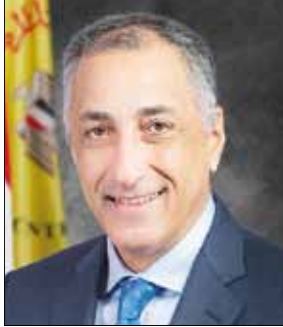
■ طارق عامر

وذكر ان التطورات الاقتصادية العالمية السلبية التي تفاقمت مؤخرًا بسبب الحرب في أوكرانيا كانت هي السبب الرئيسي في هذه التعديلات على صعيد السياسات. كما أنها تعكس الحاجة لمعالجة التحديات الهيكلية التي يواجهها الاقتصاد المصري والتي أدت إلى ضعف أداء الصادرات غير النفطية والاستثمار الأجنبي المباشر مقارنة بإمكاناته المحتملة.